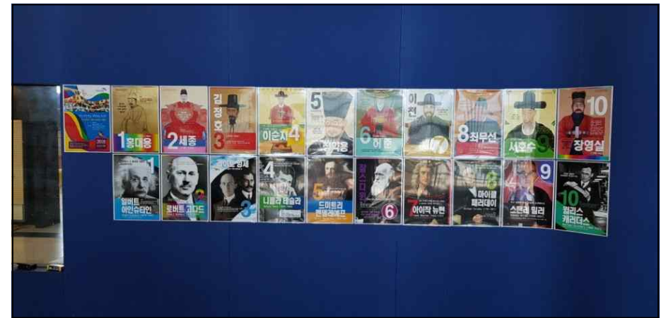
과학자 후보포스터 설치사진(과천과학관 중앙홀 2층)